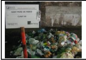
2. Identificació del Lot