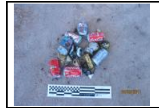
12. Metall fèrric