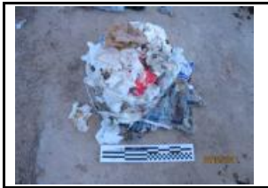
9. Paper i cartró