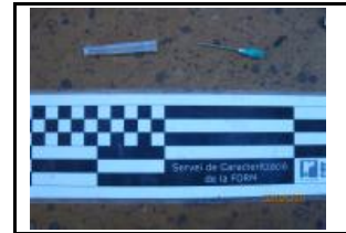
20. Altres aspectes

SANT PERE DE RIBES, 18 de febrer de 2011