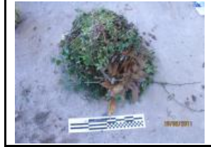
7. Poda no voluminosa (trobad a la mostra)