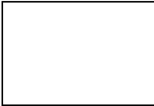
5. Poda voluminosa (trobad a al lot)