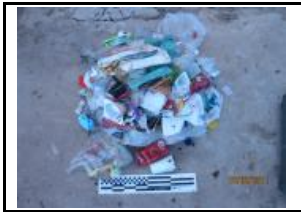
10. Plàstic, mixtos i film