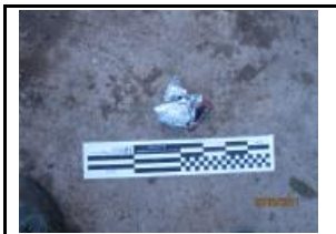
13. Metall no fèrric