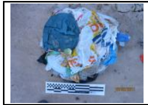
11. Bosses de plàstic