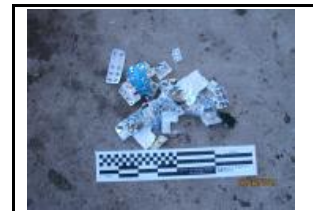
16. Residus especials