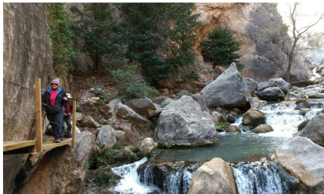
Pasarelas de Valloré

Ajuntament de Cunit Regidoria de Medi Ambient i Sostenibilitat Telèfon: 977676318 totnaturacun@gmail.com mediambient@cunit.cat