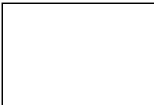
5. Poda voluminosa (trobad a al lot)